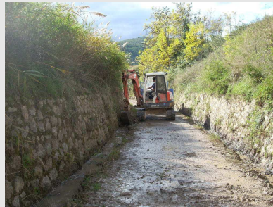
Apertura de cunetas