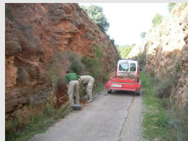
Retirada de desprendimientos