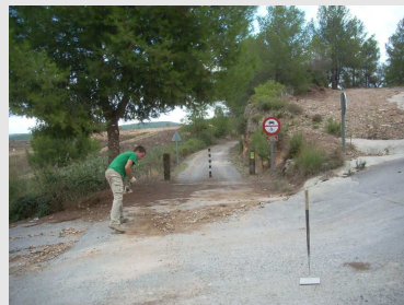
Vigilancia y reparaciones